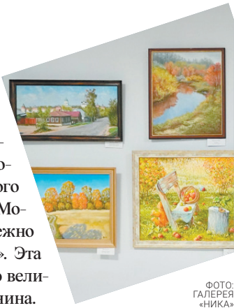
ФОТО ГАЛЕРЕЯ «НИКА»