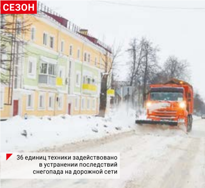
36 единиц техники задействовано в устранении последствий снегопада на дорожной сети