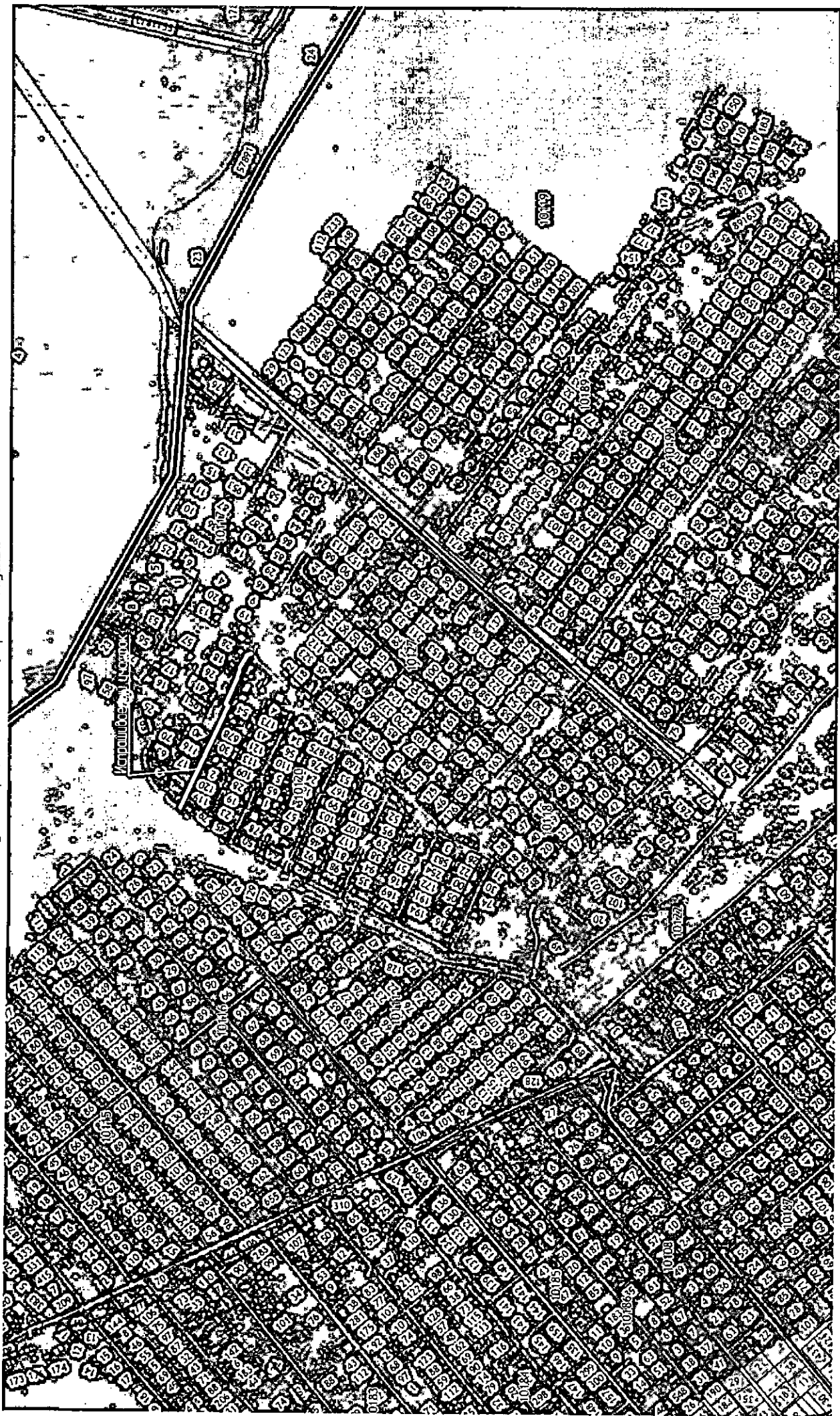
СИТУАЦИОННЫЙ ПЛАН МО, Ступинский р-н, с/п Северное, в р-не д Полицию